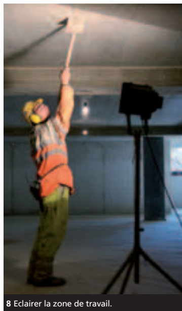
8 Eclairer la zone de travail.