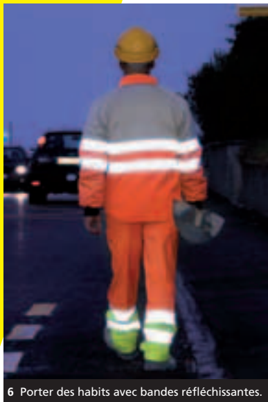
6 Porter des habits avec bandes réfléchissantes.