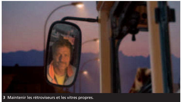
3 Maintenir les rétroviseurs et les vitres propres.