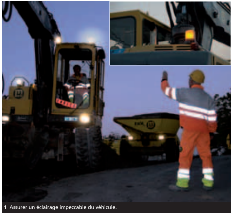
1 Assurer un éclairage impeccable du véhicule.

SBV Schweizerischer Baumeisterverband SSE Società Suisse des Entrepreneurs SSIC Società Svizzera degli Impresari-Costruttori Societad Svizra dals Impresaris-Constructurs