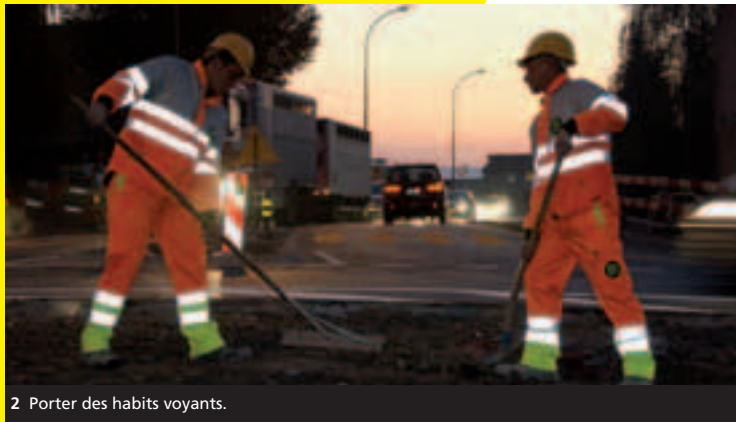
2 Porter des habits voyants.