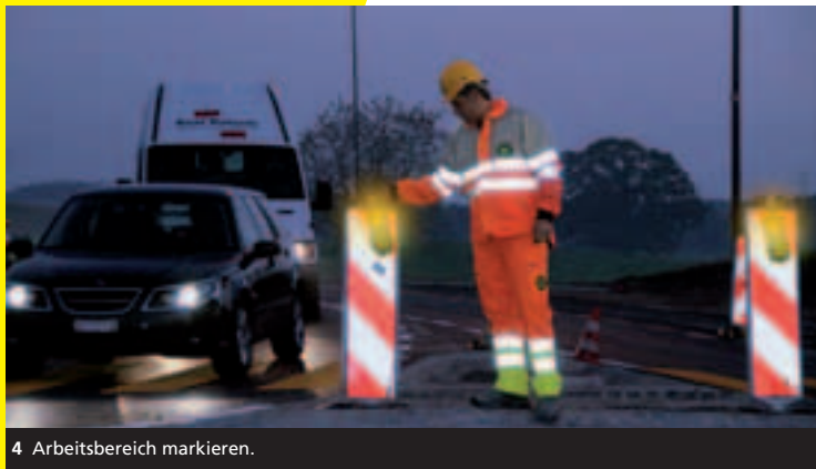
4 Arbeitsbereich markieren.