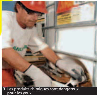
3 Les produits chimiques sont dangereux pour les yeux.