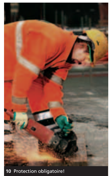
10 Protection obligatoire!