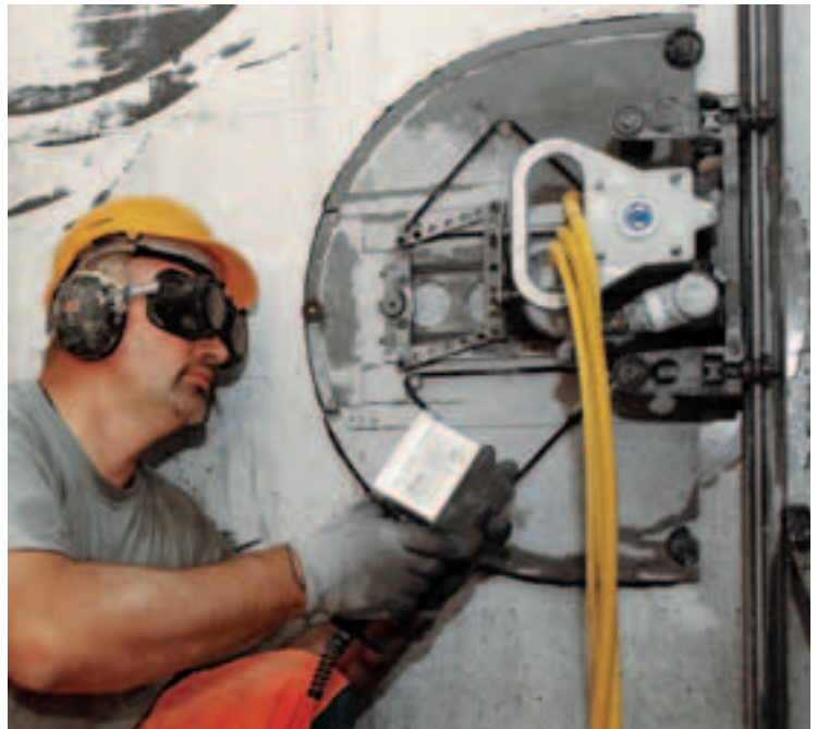
1 Sécurité lors du sciage du béton.

SBV Schweizerischer Baumeisterverband SSE Società Suisse des Entrepreneurs SSIC Società Svizzera degli Impresari-Costruttori Societat Svizra dals Impresaris-Constructurs