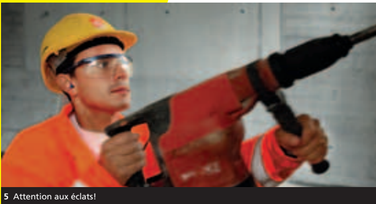
5 Attention aux éclats!