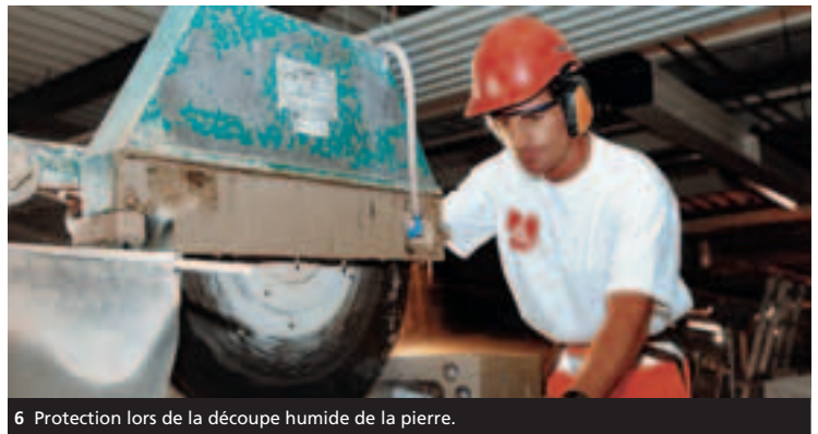
6 Protection lors de la découpe humide de la pierre.