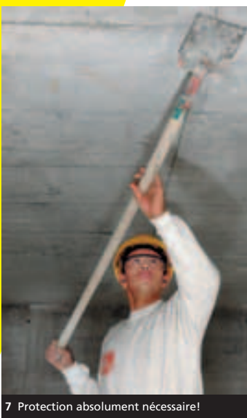
7 Protection absolument nécessaire!