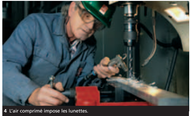
4 L'air comprimé impose les lunettes.