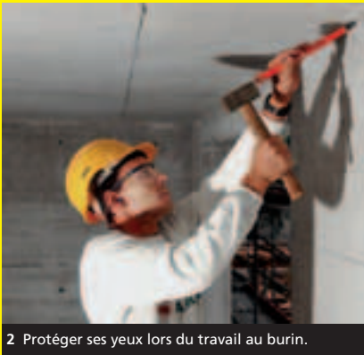
2 Protéger ses yeux lors du travail au burin.