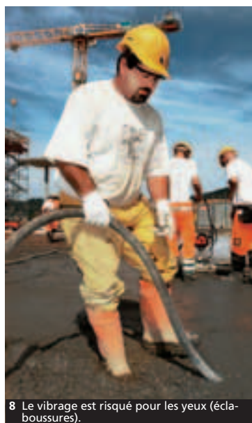
8 Le vibration est risqué pour les yeux (éclaboussures).