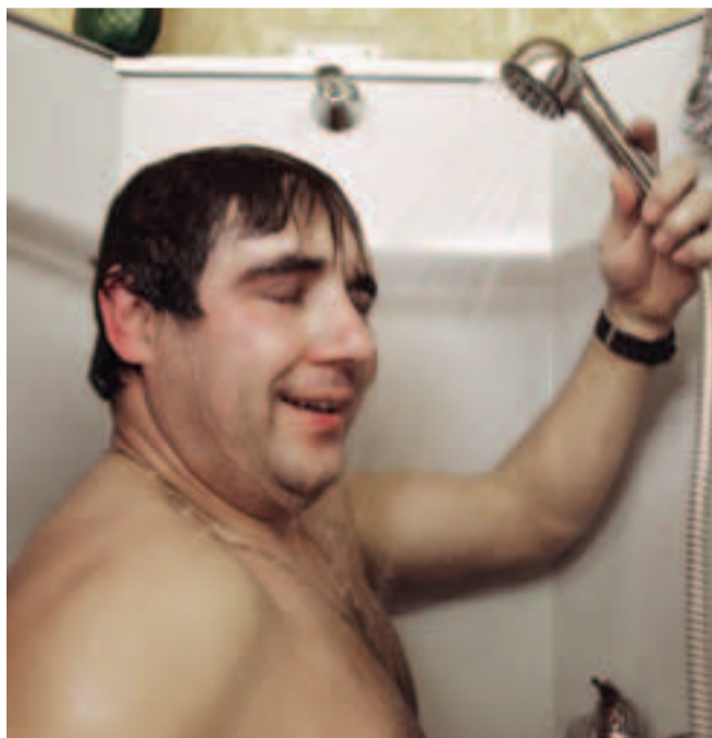
Nach der Arbeit duschen.