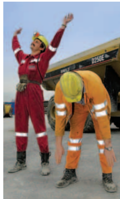
Verspannte Muskeln lockern.