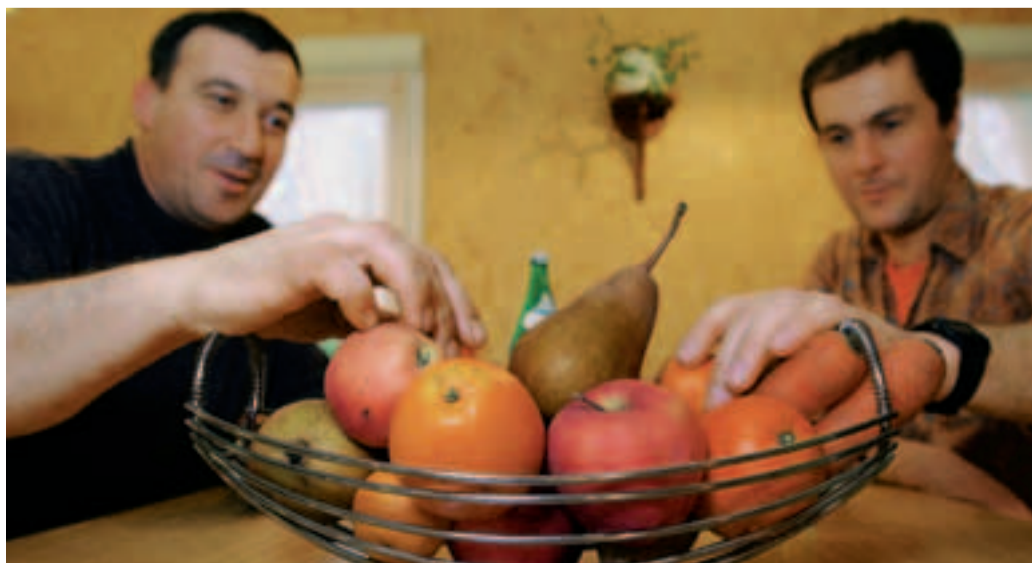
Täglich Gemüse und Früchte.