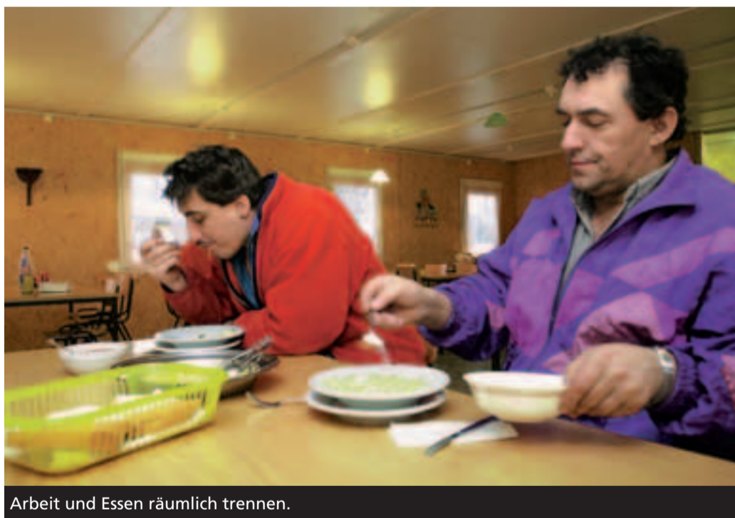
Arbeit und Essen räumlich trennen.