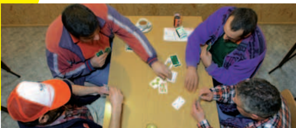
Stressausgleich durch Kontakt, Spiel und Spass.