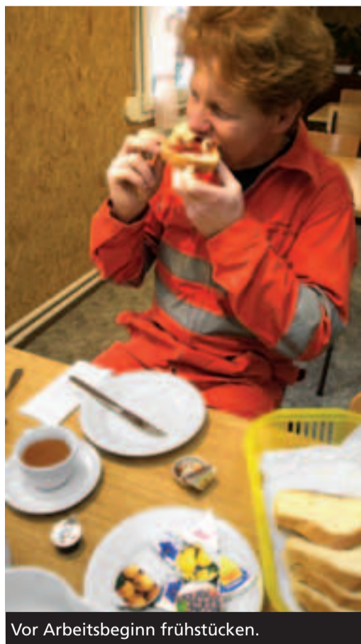
Vor Arbeitsbeginn frühstücken.