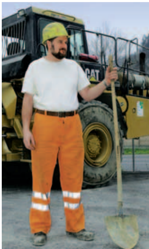
Nie ohne T-Shirt.

SBV SSE SSIC Schweizerischer Baumeisterverband Société Suisse des Entrepreneurs Società Svizzera degli Impresari-Costruttori Societad Svizra dals Impresaris-Costrutors